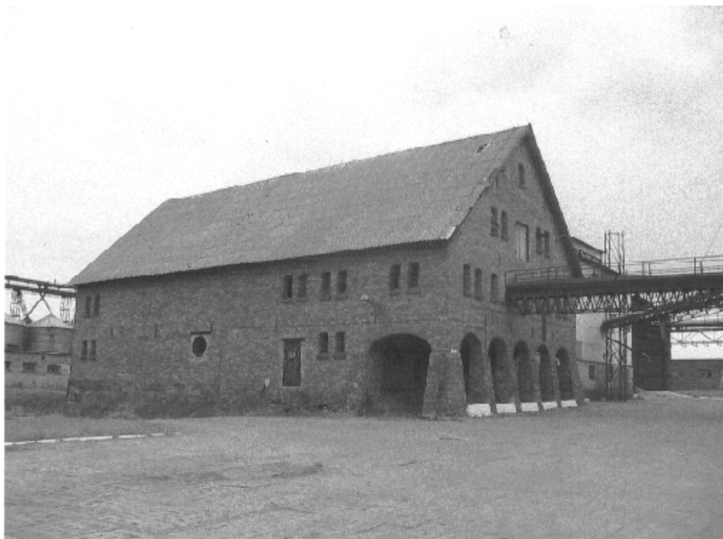
Spichlerz w Osówcu

Plan ten został przedstawiony do akceptacji mieszkańcom miejscowości Osówiec na Zebraniu Wiejskim dnia 21 maja 2008 roku, gdzie został zaakceptowany i przyjęty uchwałą. Kolejne Zebranie Wiejskie z dnia 16 lutego 2009 roku przyjęło uchwałą proponowane przez Grupę „Odnowa wsi” zmiany aktualizacyjne Planu, dotyczące przede wszystkim harmonogramów oraz kosztorysu prac.